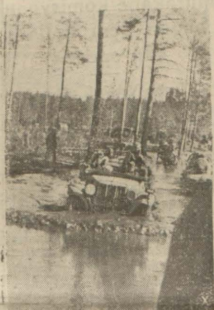
Sark cephesinde karların erimesi neticesinde bataklığa sapanan motörli taşıtlar

Alman tebliği: "258 tank, 1333 top, hesabsız silâh ele geçirildi"